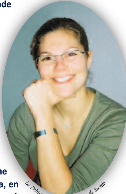
La Princesse Héritière Victoria de Suède.

C'est en jean et pull vert jade que la Princesse Héritière Victoria de Suède reçoit "Liens" pour une interview exclusive dans les nouveaux locaux un peu loft du Swedish Trade Council et de la CCSF à Paris. Vive, très spontanée et souriante, la jeune Altesse - elle a 25 ans - semble se fondre sans problème dans son environnement passager. Oui, Paris est une ville "fantastique" et elle y a, en peu de temps, beaucoup appris.