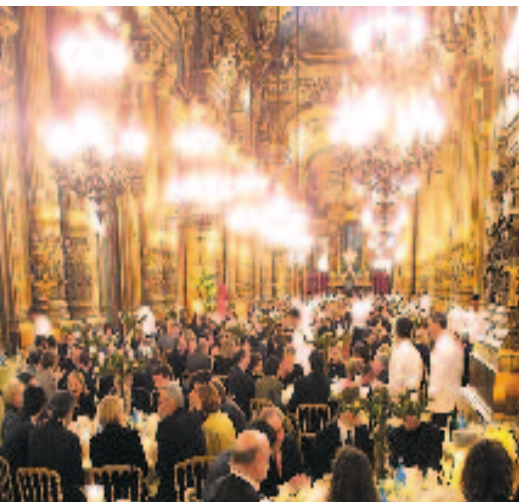
Le dîner au Grand Foyer proposant un menu gastronomique suédois.

Le Ministre a formulé, en français, un éloge appuyé à la France et à “l’amitié qui lie nos deux pays depuis des siècles” . Il a en outre tenu à réaffirmer combien “la Suède d’aujourd’hui” sait souvent, mar-