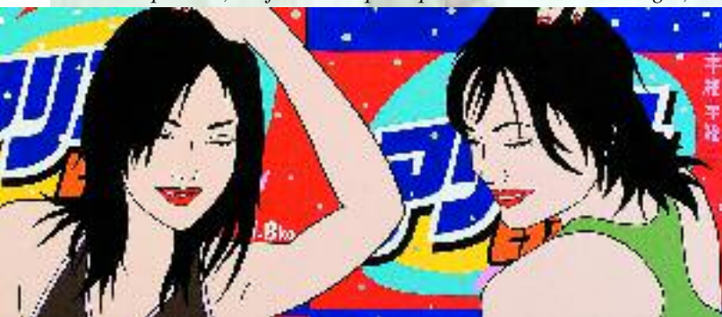
Double Happiness, 2005 par Maria Manuela. Couleur Flash vinyle sur toile de lin.