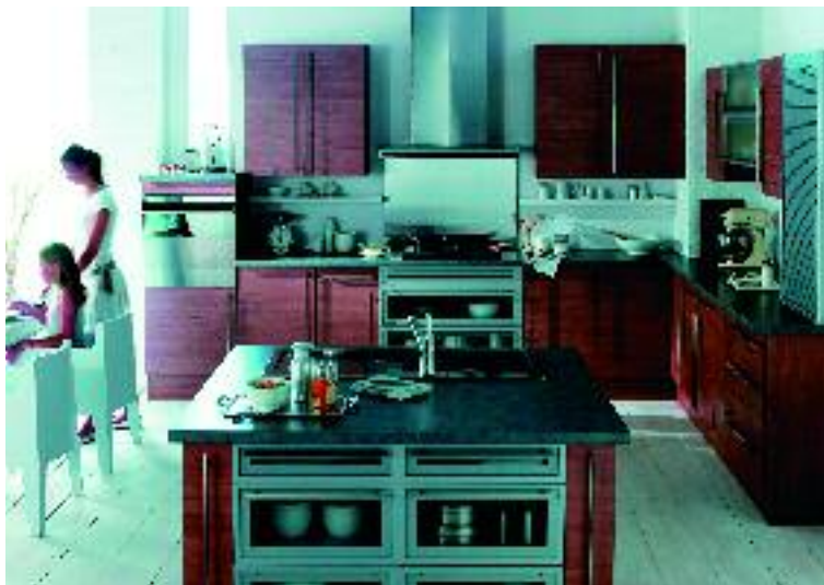
Un des dernier modèle de cuisine de Hygena.

L'enseigne française Hygena, créée à Lille en 1983, était une filiale du groupe britannique MFI. La vente d'Hygena, dont les bons résul-