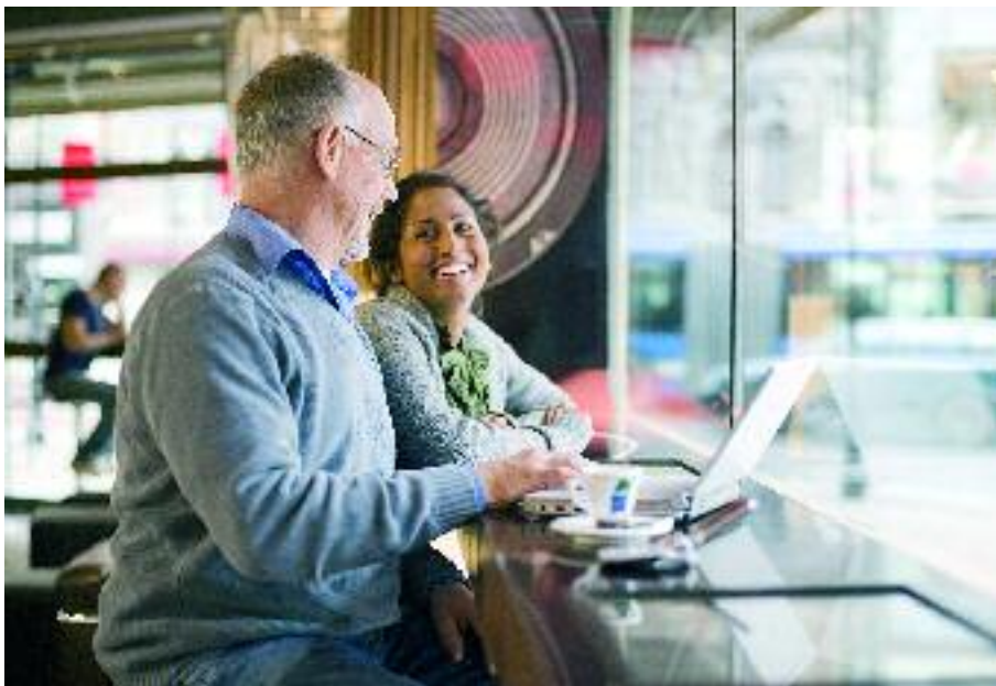
TIC dans la vie de tous les jours.

Grâce à des débits environ 40 fois supérieurs au GSM, les applications 3G sont multiples : téléchargement et envoi de sons et vidéo, vidéoconférences, synchronisation avec son