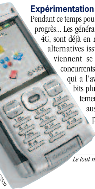
Le tout nouveau Sony Ericsson P990i.