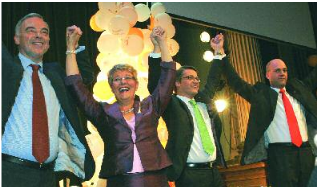
L'alliance du centre-droit représentée par Lars Leijonborg, le parti libéral ; Maud Olofsson, le parti des centristes ; Göran Hågglund, les démocrates chrétiens et Fredrik Reinfeldt, les modérés, la nuit de la victoire.