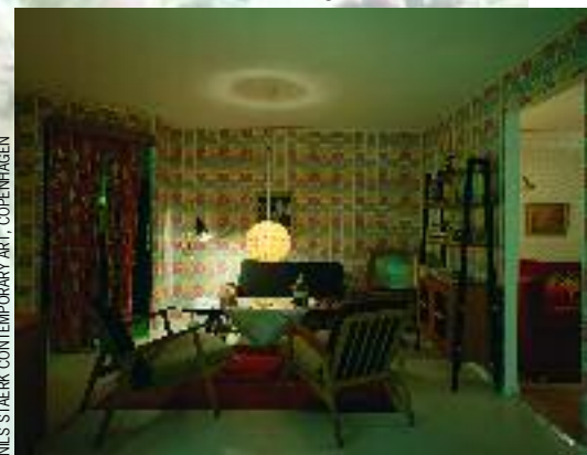
© MIRIAM BÄCKSTRÖM 22.02 COURTESY NILS STAERK CONTEMPORARY ART, COPENHAGEN