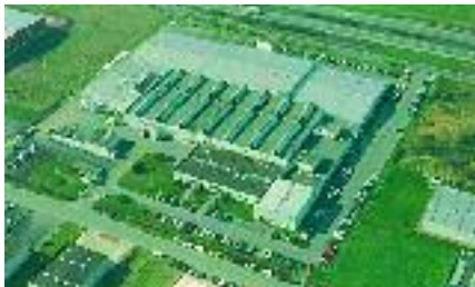
Site SNFA près de Valenciennes.

L'acquisition par SKF de l'entreprise française SNFA , fabricant de roulements pour l'aéronautique et les machines outils (voir notre numéro de juin) vient d'être finalisée, après approbation de la Commission européenne et de Bercy.