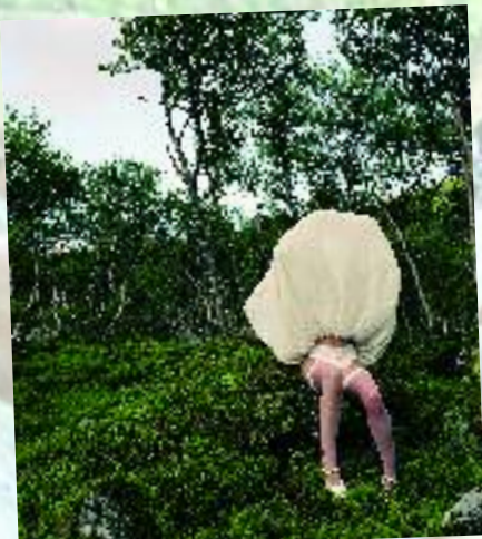
Isabelle, 2001, par Susanna Hesselberg. Photographies.

Parmi les nombreux partenaires internationaux de l'événement figuraient, côté-