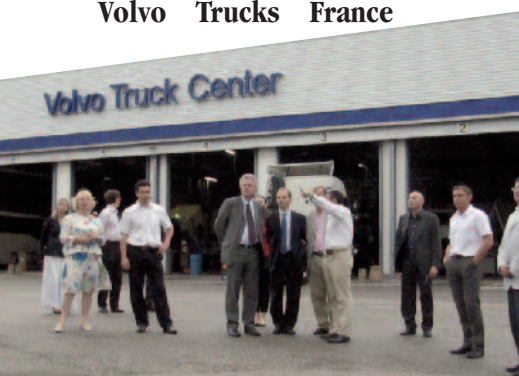
Lors de la visite le 10 juin dernier chez Volvo Trucks à Lyon.

■ Juin : accueil instructif chez Volvo Trucks France